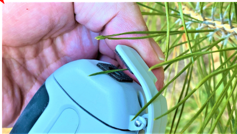
1本だけでも計測は可能。