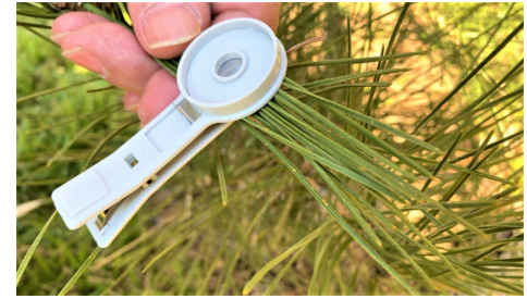
2. リーフクリップで暗処理する。