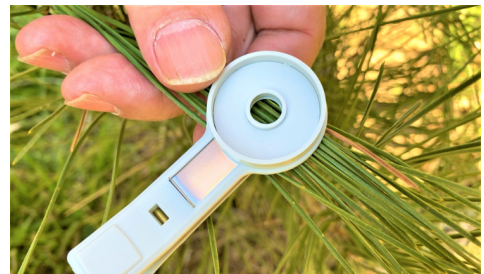
3. リーフクリップのウインドウを開ける。 (ここでは説明のために開けた状態を撮影しています。 実際はE-FP110/Dを装着後に開ける)