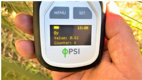
3. SETボタンを押すだけで簡単に計測可能。