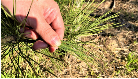
1. 葉をなるべく平面状に束ねる