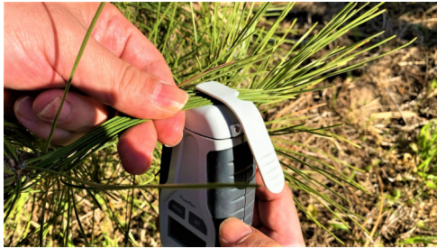
2. リーフクリップで挟み計測する。