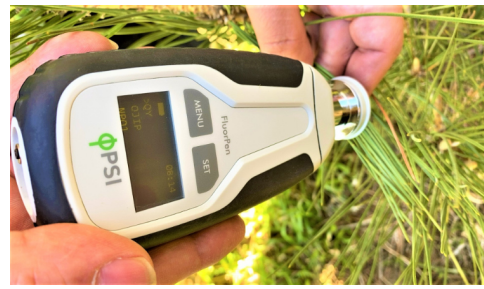
4. SETボタンを押すだけで簡単に計測可能。 左のE-FP110/S同様に松の葉1本だけでも計測は可能です。