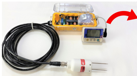
SM150Tを触らずに放置すると0.007V(ほぼ0Vにはなりません)

SM150Tを使用する前に動作確認をすることがあると思いますが、簡単な確認方法は以下のように手で握るだけで確認できます。