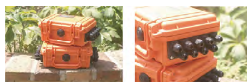
MIJ-01 データロガー用防水ケース