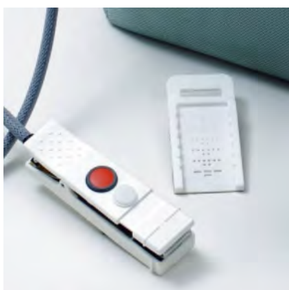
キャリブレーションプレート/チャンバーヘッド