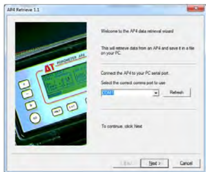
専用PCソフトウェア