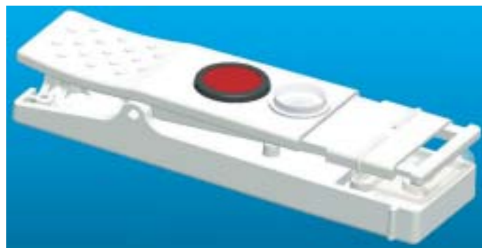
キャリブレーションプレートを装備した蒸散チャンバー