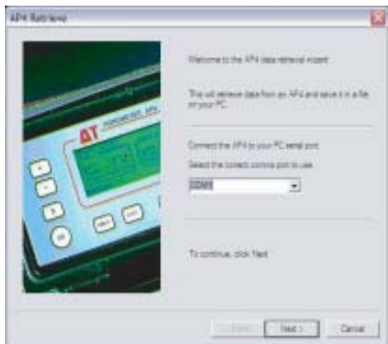
専用PCソフトウェアを装備